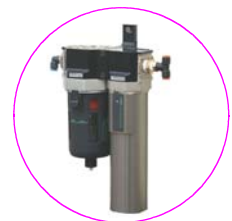
スーパードライヤーユニット