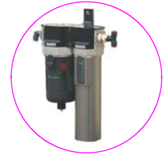
スーパードライヤーユニット